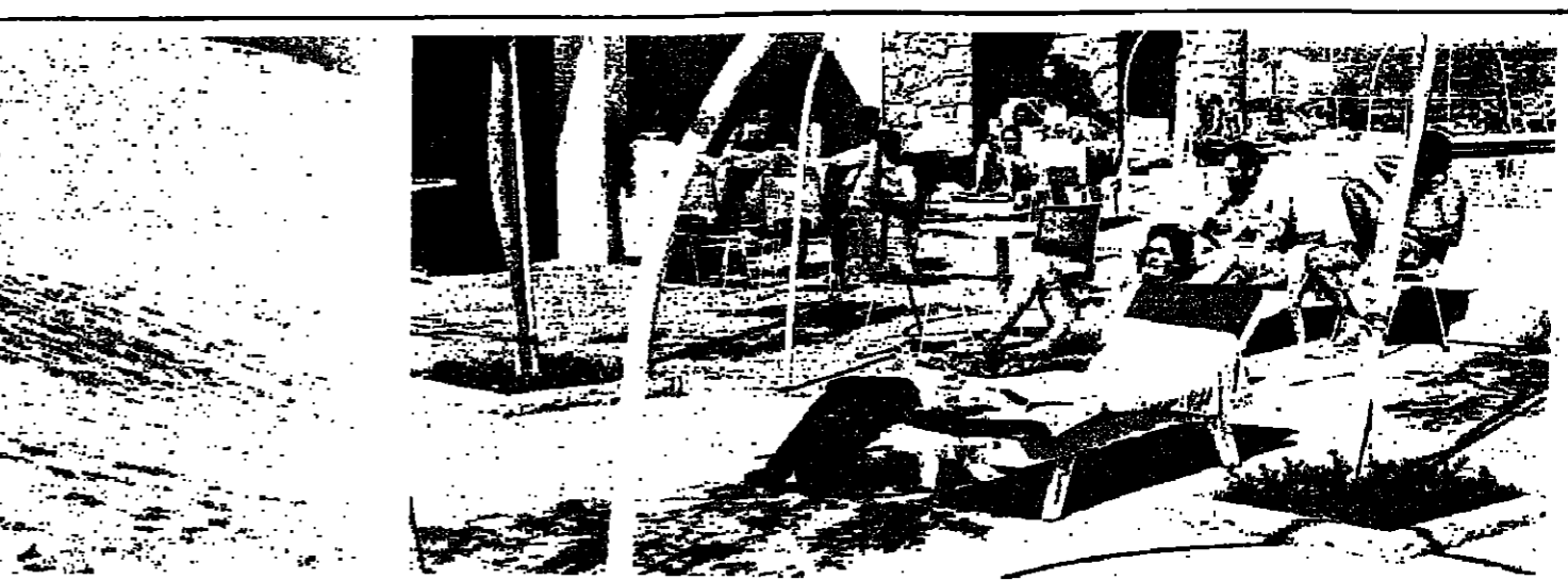
متزلج يمارس هوايته